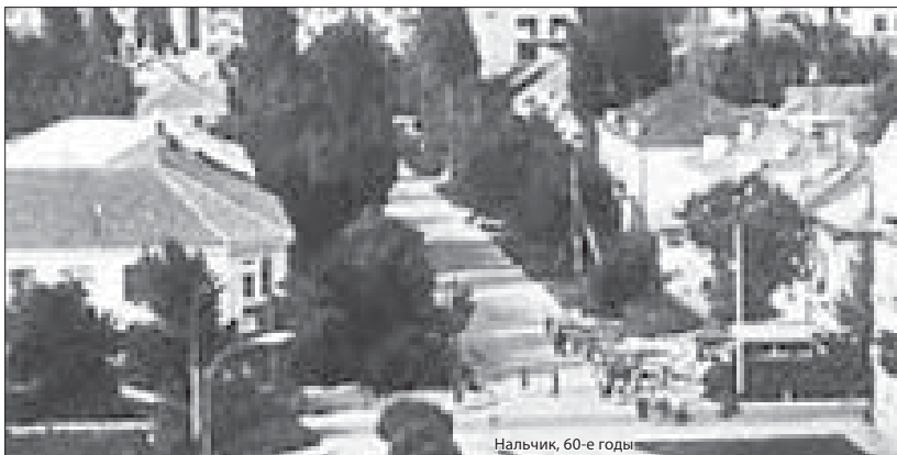
Нальчик, 60-е годы