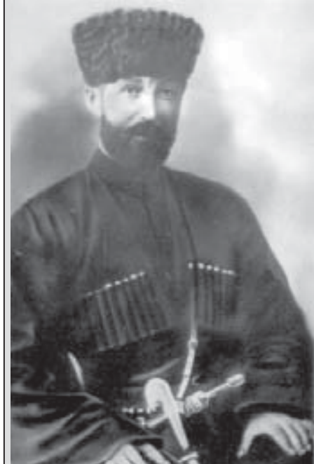
Мурзабек Конов, 1919 г.