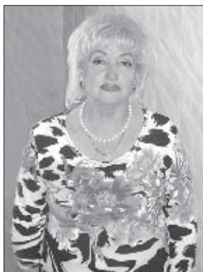
Целью мероприятия было знакомство учащихся с эстонским народом, распространение идей духовного

Редакция газеты «Горянка» предоставит политическим партиям, допущенным к участию в выборах депутатов Государственной Думы шестого созыва, печатную площадь в объеме 450 кв. см (бесплатно), а также на коммерческой основе (80 руб. за кв. см) до 900 кв. см.