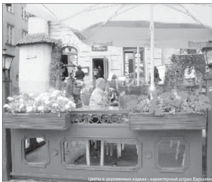
Цветы в деревянных кадках – характерный штрих Варшавы

люди, однако транспорт практически отсутствует. Вот бывший дом палача. А вот дом, где жил астролог. Каждое утро он обходил улицы средневекового города, люди смотрели, как он одет, и знали, какую ожидать погоду.