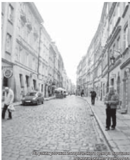
На узких улочках исторического центра Варшавы практически нет транспорта

Польша – преимущественно сельскохозяйственная страна, и всякий человек, когда-либо живший в деревне, почувствует здесь дух земли. Здесь даже во времена социалистического строя земля никогда не была общественной, не создавались колхозы и совхозы. Частную собственность на землю никто никогда не отменял. В России людей, умеющих работать, называли кулаками и целенаправленно уничтожали на заре Советской власти, Польша избежала этой трагической ошибки. Именно поэтому эта страна сегодня кормит Европу.