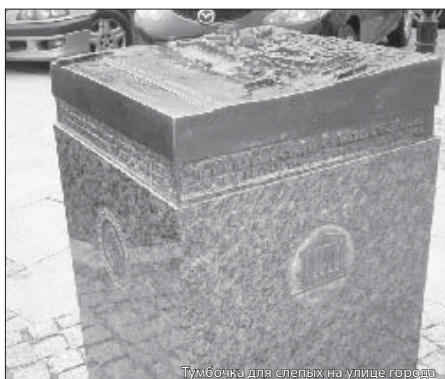
Тумбочка для слепых на улице города