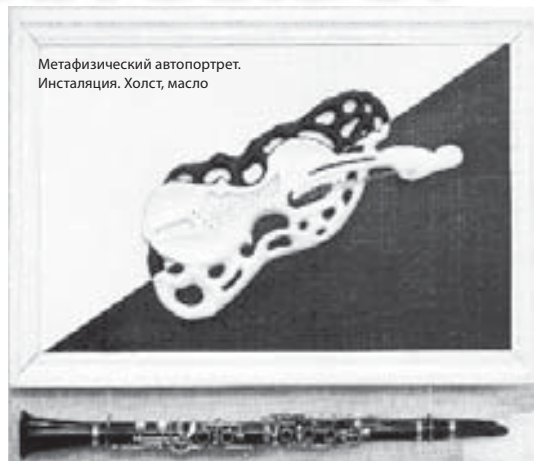
Метафизический автопортрет. Инсталляция. Холст, масло

Не приемлет жадности. Однажды на море был свидетелем, как мужчина долго торговался, выбирая самое дешевое вино для любимой. Не выдержав, Влади-