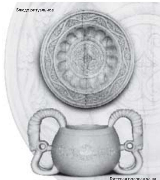
Гостевая родовая чаша

Кто же он на самом деле?.. Однажды к нему в гости приехала из села родственница преклонных лет и, увидев на полке деревянную чашу, взяла ее и, прижав к груди, прошептала: «Наше!» Действительно, декоративно-прикладное творчество балкарцев