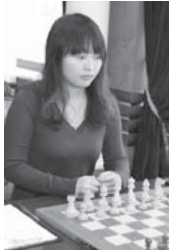
Цзюй Вэньцзюнь ▲