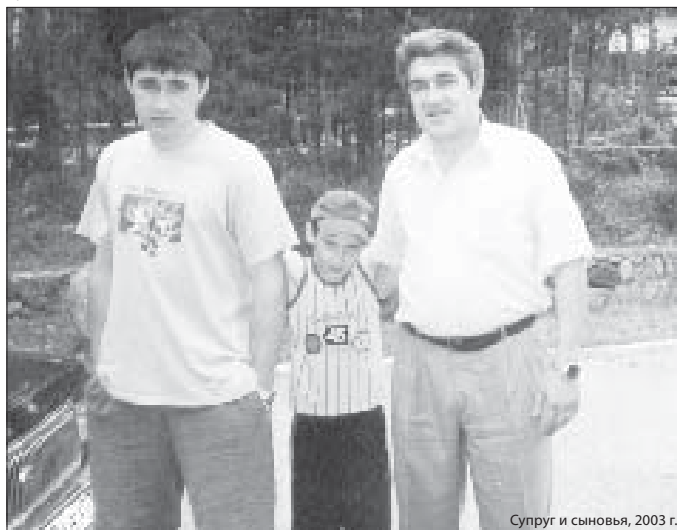
Супруг и сыновья, 2003 г.

● Наталья ПЕЧОНОВА.