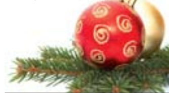
● Материалы полосы подготовила Наталья ПЕЧОНОВА

Процедура проводится с помощью специального аппарата, который направленно действует на лишний жир, предотвращая при этом охлаждение кожи, нервов, сосудов и внутренних органов. Один сеанс продолжается примерно час. При этом теряется до 1 см жирового слоя. Затем замороженный жир естественным образом перерабатывается и выводится печенью. Окончательный результат виден не раньше, чем через 2 месяца после сеанса. Стоимость одной процедуры около 1000 евро.