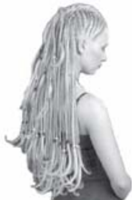
Прическа «Грива Пони» ▲