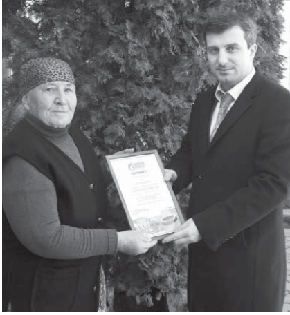
победителям вручили ценные призы.

В марте 2010 года проведена стимулирующая акция «Оплати за газ на почте и выиграй приз», в которой приняли участие 8,5 тыс. абонентов.