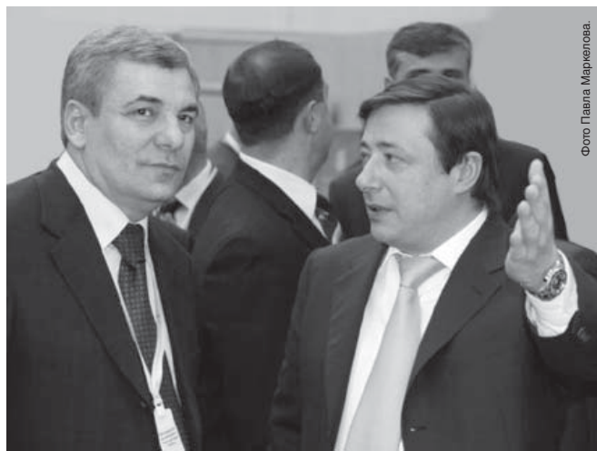
Фото Павла Маркелова.

Пресс-служба Президента и Правительства КБР