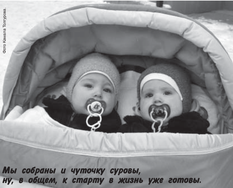
Мы собраны и чуточку суровы, ну, в общем, к старту в жизнь уже готовы.