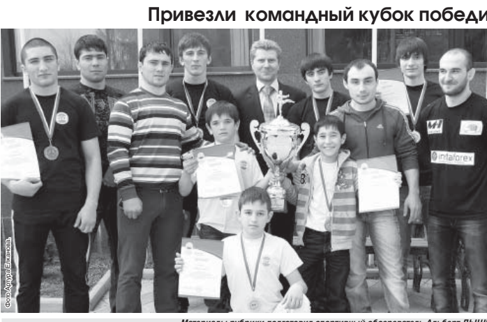
Материалы рубрики подготовил спортивный обозреватель Альберт ДЫШКОВ.

Нальчикская городская общественная организация ветеранов (пенсионеров) войны, труда, Вооруженных Сил и правоохранительных органов с глубоким прискорбием извещает о смерти ветерана Великой Отечественной войны БУДКОВОЙ Анны Федоровны и выражает искреннее соболезнование родным и близким покойной.