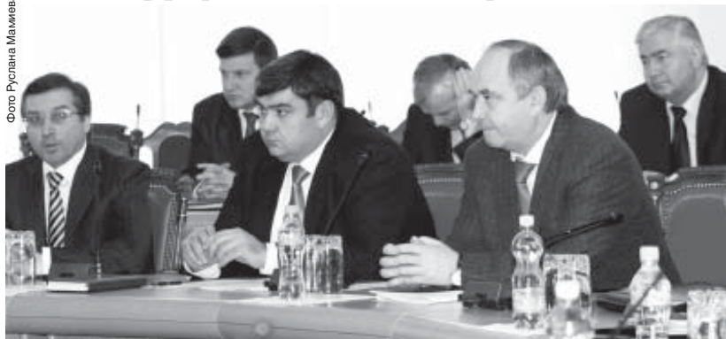
Фото Руслана Мамаева.

Пресс-служба Президента и Правительства КБР