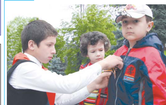
Прикрепляя ленточку на грубу, подвига страны достижим бузу! Следующий номер газеты выйдет 11 мая.