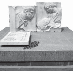
Памятник героям Великой Отечественной войны в Нальчике.

Это, наверное, самый известный в нашем городе памятник, посвященный Великой Отечественной войне. На территории Нальчика их более двадцати.