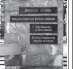
Памятник героям Великой Отечественной войны, погибшим в госпитале.

Вот еще один — памятник героям Великой Отечественной войны в 1942 году был госпиталь. При отступлении Советской Армии на рваных, ни солдатников закуривать не успели.