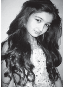
Mister Planet 2011» стала второй вице-мисс.

Амина уже привыкла к сцене. В марте в конкурсе «Маленькая красавица КБР-2011» она завоевала второе место. Жюри отметило красоту девочки и умение держаться, это дало ей право поехать в Ростов-на-Дону. Там, участвуя в региональном конкурсе «Маленькая красавица Юга России-2011», она получила титул «Мисс Грация», а на отборочном этапе международного конкурса «Little Miss &