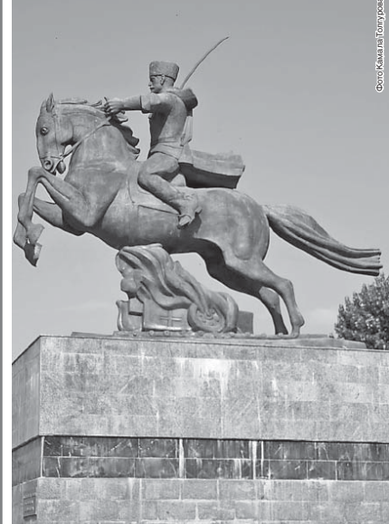
Жаухар АППАЕВА, искусствовед