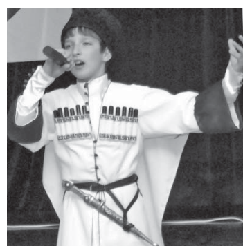
Победитель конкурса юных вокалистов «Звонкие голоса России» из КБР.

В Москве прошли прослушивания Всероссийского конкурса юных вокалистов «Звонкие голоса России», учрежденного в 2006 году. Президентом жюри в этом году был заслуженный артист РФ Бедрос Киркоров. Ежегодно в регионах тысячи детей участвуют в вокальных конкурсах. На федеральный этап приглашаются лучшие исполнители в номинациях «академическое», «народное», «эстрадное» пение. В 2011 году программа конкурса дополняется новой номинацией «авторы-исполнители». Конкурс входит в приоритетный национальный проект «Образование». Победителям и призерам вручаются дипломы и памятные подарки, а наиболее одаренных певцов приглашают на концерт Президентскими премиями. КБР представляли шесть участников. Занимая второе место в номинации «авторы-исполнители» стал лауреатом конкурса, обладателем специального диплома «За сохранение и верность народным традициям» и получил Президентскую премию.