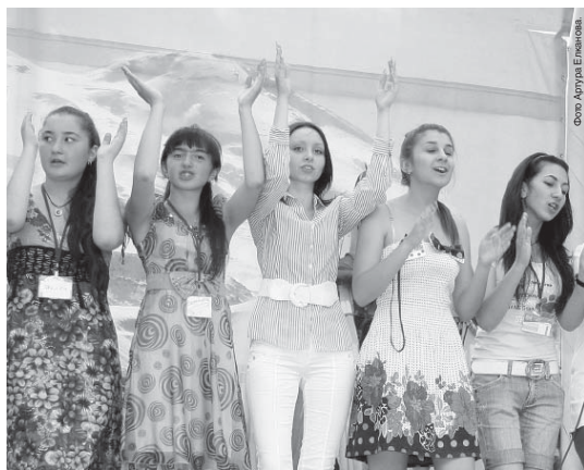
Сотра Амурра Египетова