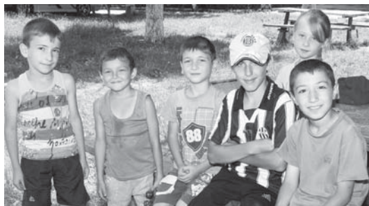
Будущие Псычоха принадлежат этим веселым ребятам.