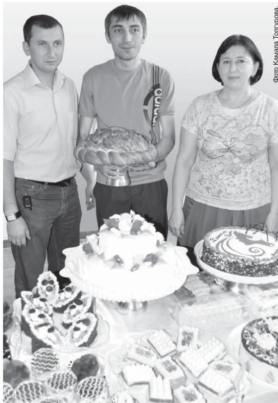
Фото Камилы Толгурова.