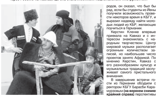
Вокальные номера театра песни «Амикс» КБГУ были представлены в виде сенок из народной жизни.