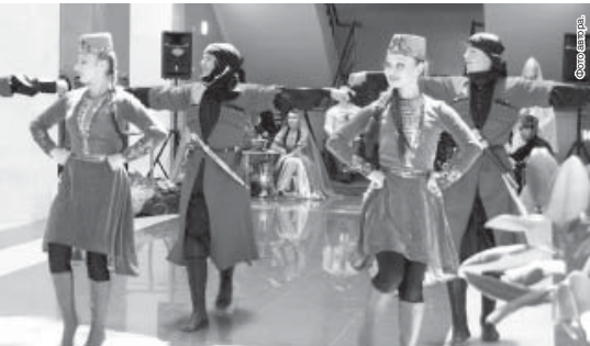
Национальная группа театра песни «Амикс» КБГУ.