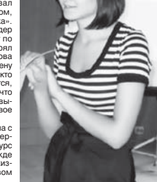
Конкурсантам также пришлось ответить на вопросы джюри участников и членов жюри.