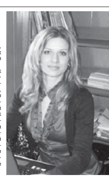
Мы проводим открытые мероприятия с приглашением гостей, участвуем в городских акциях, выезжаем за город на экскурсии...