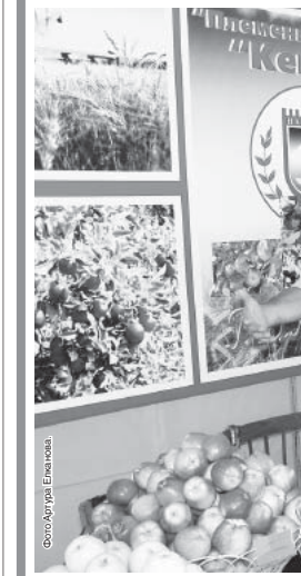
На республиканской выставке сельскохозяйственной продукции. 2006 г.