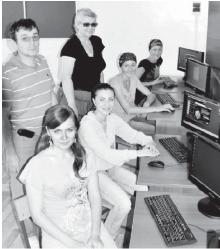
В колледже дизайна КБГУ оборудован новый компьютерный класс.