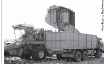
Уборка семенной кукурузы на полях агрофирмы «Отбор» Прохладненского района.