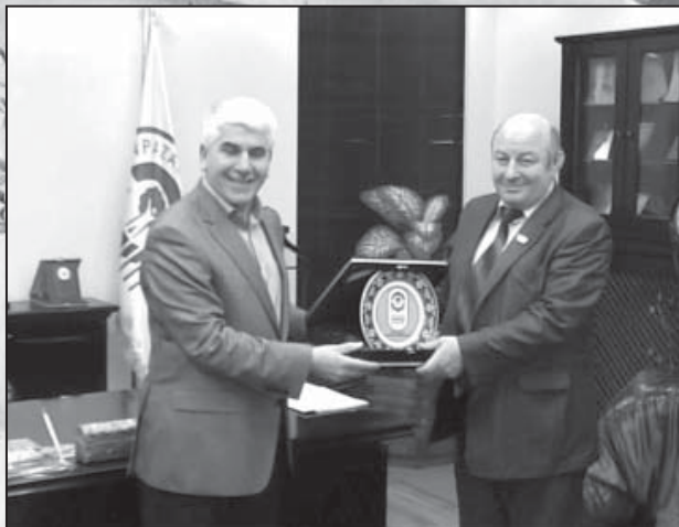
Мэр Бурхан Сакеллиден саугъа. Эскишехир шахар