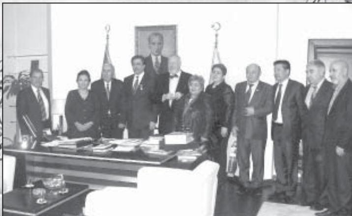
Эрдэжйсе университетини ректорунда Кайсери шахар.