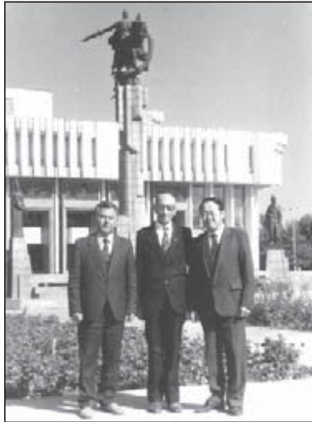
1988 жыл. Кьыргъызстанны ара шахары Фрунзе (Бишкек) химияны проблемалары бла байламлы Битеусоюз илму конференцияны делегатлары.

Жолум кьар аууиха чьгьаргъанды, Жашчыкьлай алып кетип элден. Жүрек – элли жылгъа чькьгъанды, Кьууанч, бушуу жюгюн да элте.