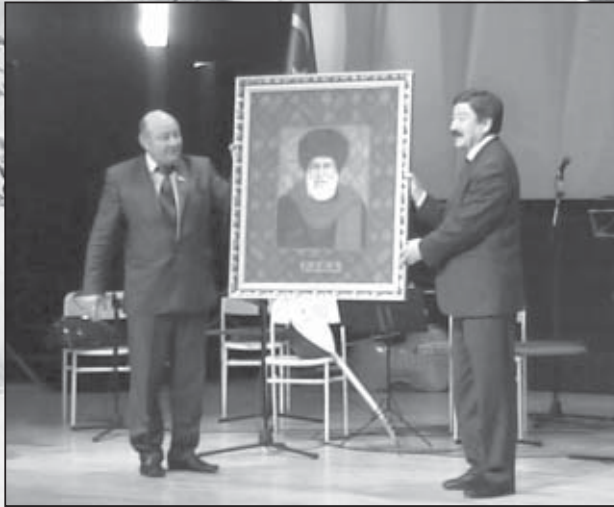
КЪМР-ни култура министерствосуну атындан – сауҕа, Кязимни Баккуланы Владимир ишлеген сураты мындан арысында ТЮРКСОЙНУ алты кьатлы мекаямыны фойесинде тагьылып турлукьду. Анкара шахар.