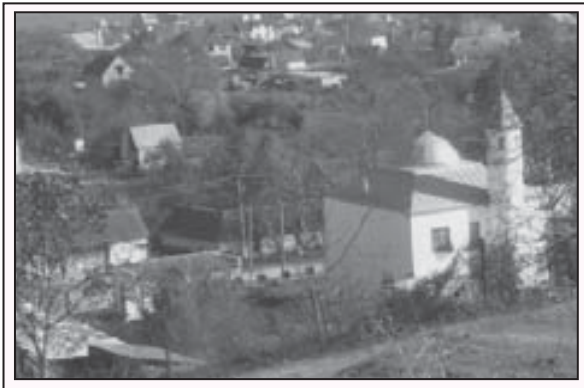
Яникой элни кёрюмдюсю