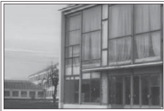
Яникойда культура юй.