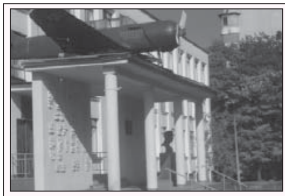
Нальчикде Байсолтанланы Алимни атын эрютген 19-чу школ