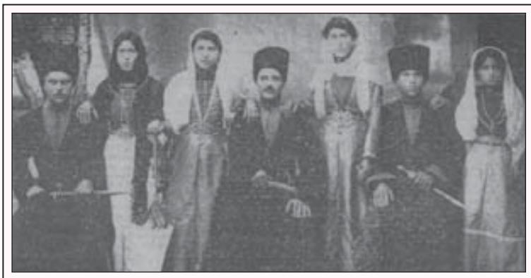
Яникойда таулу юйюрню адамлары. Сурат 1912 жылда алыннганды.