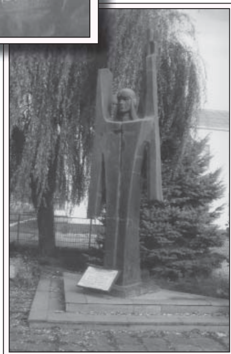
Янкойда Байсолтанланы Алимни эсгертмеси.