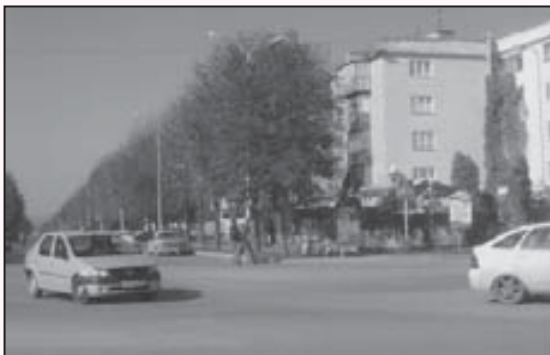
Нальчикде Байсолтанланы Алимни атын жюрютген орам