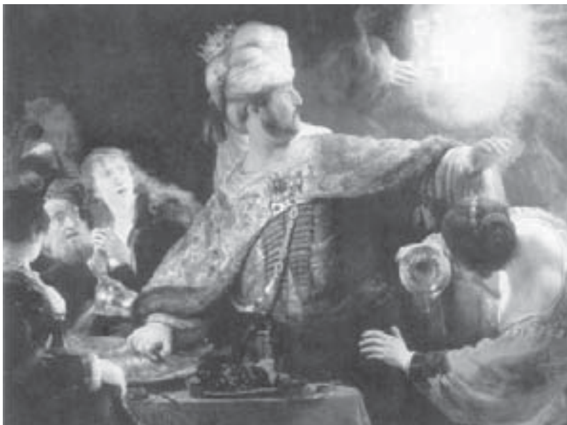
Балтасар. Ван Рейн Рембрант (1606–1669). Сурат 1635 жылда ишленгенди.