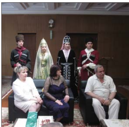
Къалэ унафэщӀымы и хэщӀапӀэм.

ДыщыхьэщӀа псэупӀэхэр илъэси 120–130-рэ хъу, бгыкӀухэр зэрылӀ, адыгэ ухуэкӀэкӀэ щӀа унэ быдэхэт. Абыхэм сурэт ятетыху лэнэхэм къытхутрагъэуващ адыгэ кхъуейжъапхъэри, жэмыкуэри, пӀастэри, лэкъумри, лыцӀыкӀулыбжъэри, хьэлывэри, нэгъуэщӀ ди лъэпкъ шхыныгъуэхэри.