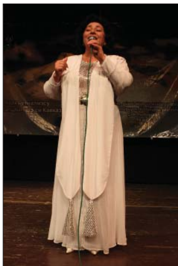
Даур Иринэ уэрэд жеIэ

лыгъуэжъхэм я ухуэныгъэхэм я макетхэр. Гъэщлэгъуэнырати, кнопкэхэм ящыщ зыр тепкъуэзмэ, узыщлэупщлэр урысыбзэкIэ къыбжилэрт. Куэдугукъинэ тщыхуащ а музейр.