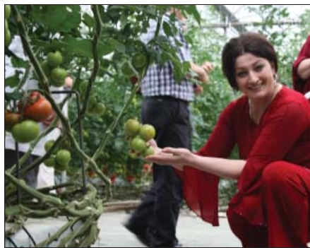
Тыркум щыпсэу адыгэхэм лэжъэжIи яцIэ. ХъэщIэхэр ирагъэблэгъащ помидор цагъэжI хуабэщым.

Ди хэкуэгъухэм Мысостышхуэ Пщызэбий егъэлеяуэ фIыуэ ялъа-гъуу, ЖъэкIэмыхъу КIунэ яцIыхуу, КъардэнгъуцI Зырамыку и тхыгъэхэм щыгъуазэу, Налэ Заур жыплэмэ, я псэр къыхыхъэжу къыщIэкIащ. Абыхэм я лэжыгъэм теухуа упщIэ куэдкIи зыкъытхуагъэзащ.