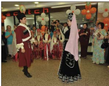
Наурыз Нефрин и тыкуэныр къыщызэлуахым.

Адыгэ Хасэм и унэм дэ дащылуцIащ хэгъэрейхэм я къэфаклуэ, уэрэдджылаклуэ гупхэм хэтхэм, литературэм, музыкэм, театрым дихъэххэм. Дэтхэнэри хуцIэкъут езыр дзыхъэхым теухуауэ щIэ гуэр къызэрищIэ-ным. Дэри дызыщIэупщIэн дилэт. Гуапэт ди лъэпкъэгъухэм адыгэбзэкIэ дазрепсальэр гуфIэгъуэшхуэ зэралъытэр.