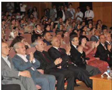
Концертным кыекыуэллэхэр кудэ дьдэ хъурт.

Дэ япэ шфыклэ дыщетфысэхар Истамбылти, аэропортым дыщыщфыхам, Истамбыл шфылэ Адыгэ Хасэхэм ящыщ зым и тхъэмадэ Жылэхъэж Эрдогъэн кыитпэллэрт и лэжьэгъу гуп и гъусэу. Антеп дыкыуэн хуейт, кхъухъльбатэм дитфысхъэжуи, зэманыр къэблэгъэху дызэпсалъэу дыщысаш. Антеп гуапэу кыыщитпэжьэщ удз гъэгъэхэр зыфыгъ гупышхуэ, гъуэгубгъум деж зы джэгъушхуи щытщыри, Мараш дашащ. Хэщлэплэ тхуащлэщ «Соффрон» хъэщлэщ ехъэжьар.