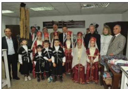
Мараш къащыІуцІа хэгъэрейхэр.

Бязит кыыщІэлъэІурт хэкужъым шыщхэм езыхэм зэхагъэувэжа адыгэ концерт яхуэтшэу я цыхухэм едгъэлыагъуну. Абы теухуауэ ды-