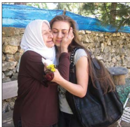
«Хэкуужьым къыкӀа слъагъуны сыщӀыгугъыжакъым».