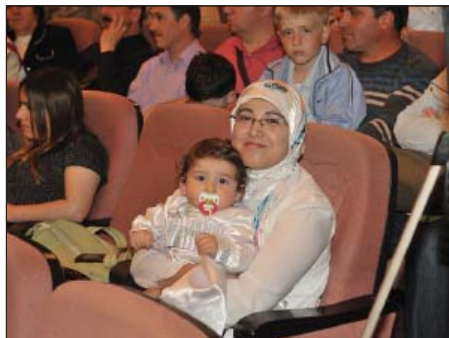
Усабийуэ пльагъур нэхъ уигу къынэжу жалэ.

Сценэр удз гъэгъакIэ екIуу гъэщлэрэщлат, и блыным «Налкъутналмэ-су зэщлэпщыпщлэ си Кавказ» жилэу тетхат. Нэхъыбэу усэбзэкIэ гъэпса ди сценарийм Хэкум, лъэпкъ хабзэм, лъагъуныгъэм теухуа уэрэдхэр ебэкIырт. Апхуэдэт, псалъэм папщлэ, «Адыгэ лъахэ», «Хэт жызылэр адыгэр дыкIуэдыжыну?», «Си Налшык», «Адыгагъэ», «Си дахашэ», «Псылэ-рышэм и уэрэд», «Дахэжан», «Губгъуэм ит тхъэрыкъуэ», «Еджэры-къуей», «Зэзэмызэ уи гум сыкъэгъэкI», «Мазэгъуэ жэщ» уэрэдхэр. Концерт программэм театр теплэгъуэхэмрэ гушылэхэмри хэдгъэхьат.