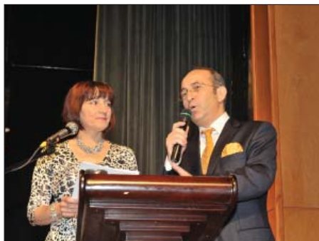
Беслэней Натэрэ Емүз Невзэтрэ концертыр ирагъэкIуэкI.

– Тырку тхакIуэ цлэрыуэм и цлэр зэрыхъуэ Мараш къалэм щылэ «Нефэка» Щэнхабзэ центр инырщ ди ялэ концертыр щыттар. Цыху 800 хуэдиз щлэхуэрт абыи, тысыплэрэ лъэ увьплэрэ имьлэжу цыхухэр къызэхуэсат.