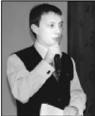
Г. Урусова.

- Каждый из тех, кто решил принять участие в этом конкурсе, отчаялся выйти на эту сцену, уже может считать себя победителем, - сказал, открывая мероприятие,