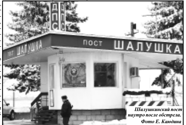
Шалушкинский пост наутро после обстрела.

Режим КТО предусматривает ряд временных ограничений и режимных мер, например, проверку документов, усиление охраны общественного порядка, введение контроля телефонных переговоров, приостановление оказания услуг связи юридическим и физическим лицам или ограничение их использования и даже временное отселение физических лиц, проживающих в пределах территории, где вводится режим КТО, а также ограничение движения транспортных средств и пешеходов с 21.00 до 06.00 часов.