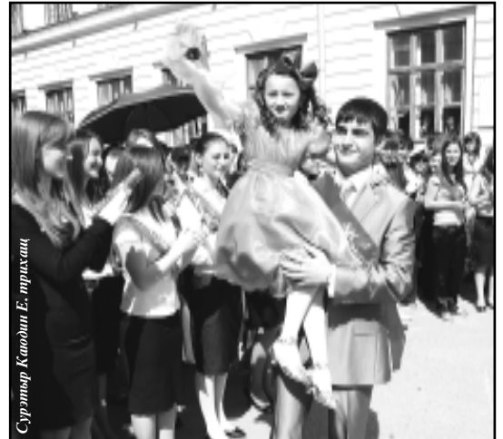
Суратыр Каодин Е. ирхыщлэ

Иджы къысфлэщлэр дыгъуасэ хуэдэу Уэ сэ си пашхьэм уштыгъэр, Уэушциуэ, жылэщлэ сыпщлэу Кьызырлэжыуэ хьэл къысхэпщлэхэр.