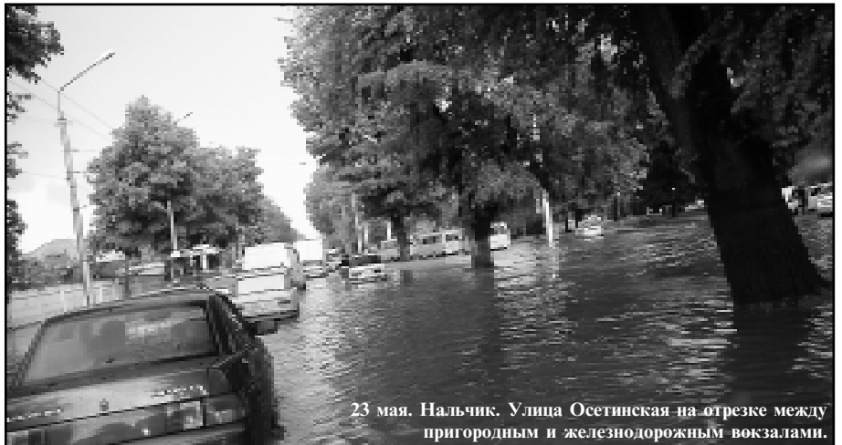
23 мая. Нальчик. Улица Осетинская на отрезке между пригородным и железнодорожным вокзалами.

Также отказались от служебного транспорта мэр Нальчика, его заместители и сотрудники администрации. Предполагается, что все они в течение недели будут использовать общественный транспорт.