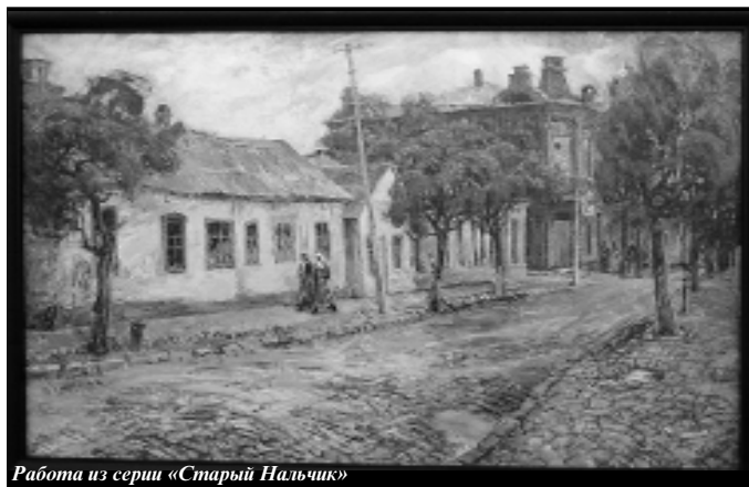
Работа из серии «Старый Нальчик»