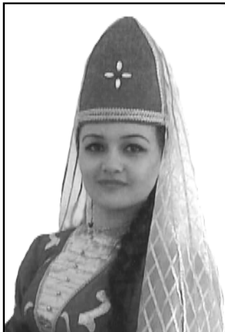
НАНЭ Мыр пшыкышIэ, е нэхуапIэ? Сыздэжыем си нэклум гуапэу Iэ къыделъэ нанэ.

ди гуфIэгъуэр Жьыми IшIэми псэIэ зыхьтIшар.