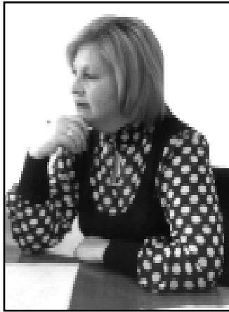
ГушIылагуэ абы хэлъу хуахэр Хуам Iшымахуэ дунейр ягъэщIант. Гу пшIырыгъэ гуапэу шыбгъуахэр Зы хуэжам, гъэмахуэр имыкIант.

И лъагагъэIэ Iуащкымахуэ хуэдэу Хуэнти ар, бгы уэгум схуишIам.