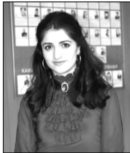
- Диплом лэжыгъэр дызыхуей темэм тедухунэ дыхунити, сэ сину къэклэш хамэ къэрал куэдм шыцлэрыуэ...