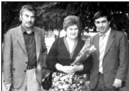
Жарылгъан ташладан учарла Жумдурукъ маталлы жулдузла...

Жерини ташлары ачырла Терлики огъундан жыгълсам,