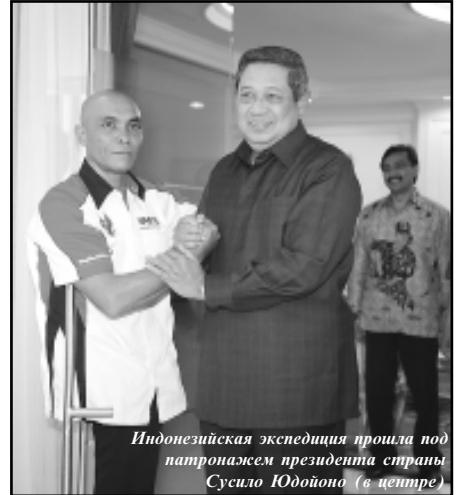
Индонезийская экспедиция прошла под патронажем президента страны Сусило Юдойоно (в центре)

На традиционный вопрос – не было ли при поездке на