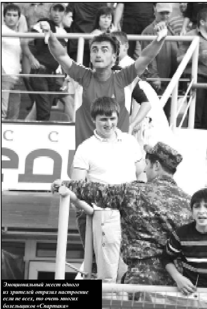
Эмоциональный жест одного из зрителей отразил настроение болельщиков «Спартак»