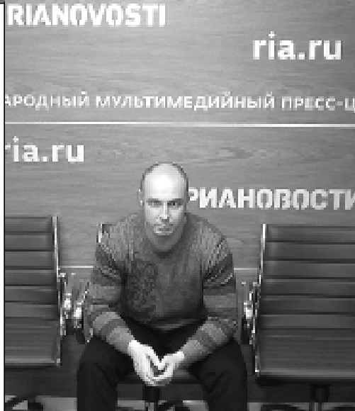
Я – член ПЕН-клуба РИА Новости. До сих пор, правда, не знаю, что такое ПЕН. Но что такое РИА Новости, я теперь знаю, можно сказать, из первых рук и не забуду того, что узнал, когда.