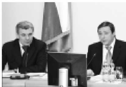
РФ-ни Правительствосуну Председателини орунбасары, РФ-ни Президентини Север-Кавказ федеральный округда толук эркинлик келечиси Александр Хлоповни Къабарты-Малкъарны СКФО-да айныргъа башхаладан эсе уллу онглары болгъан регионнга санагъанды. Аны юсюнден ол барак кюн КъМР-ни Правительствосуну ююнде болгъан кенгеште айткъанды.

эксперт къауым къураылгъан билдиргенди. «Россовни Президентини онуу бла биз бу ишни регион кесинде бардырлыкъбыз. Программаны жарашдыруу, бу проблеманы тамамлауу жолларын белгилеу жаны бла бизде тобашууе, тинтилеу анта болукъдула», - дегенди.