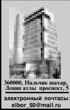
360000, Нальчик шахар, Ленин аты проспекти, 5. Электронный почта: elbor_5@mail.ru