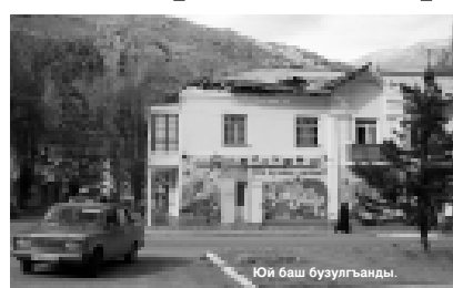
Юй баш бузулгъанды.

Элбрус районда жашагъанла юкюно желлеге юйречек болуп кыалгъандыла. Алай бу ююнде колпача боран эрттерден бери да болмагъанды.