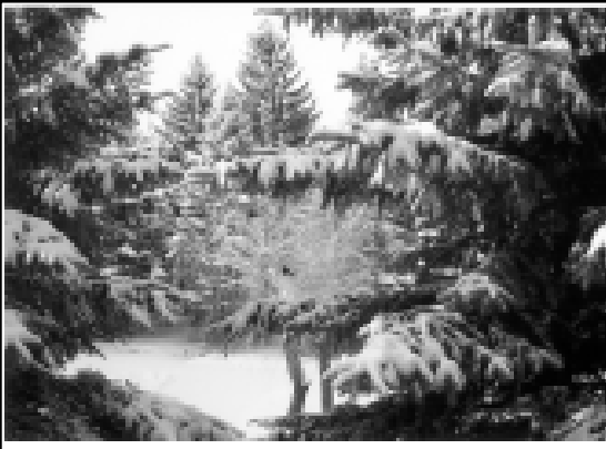
Къшы накъышыла.