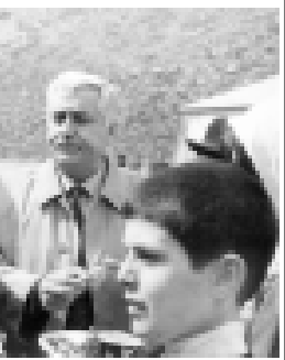
Кваншаубиев Тюркден келген жазуучу бла Огары Чегемде кыонакыда