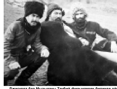
Джигурда бла Мызыланы Таубийе фильмден биринде ойнай турган кезинде