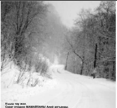
Кышы тау жол. Сурат этюдно МАМАЙЛАНЫ Алий алганды.