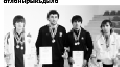
Кыярач-Черек Республикасы Уст-Джеугата карателен Свердлов-Кавказ федералык олимпияд чемпионатын бербурганды...