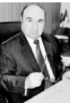
1975 жылда Нальчик шахар эки районга бөлүүнгөндө, аны партияны Октябрь райкомуну экинчи секретарына айырган эдиле. Иш көп эди.