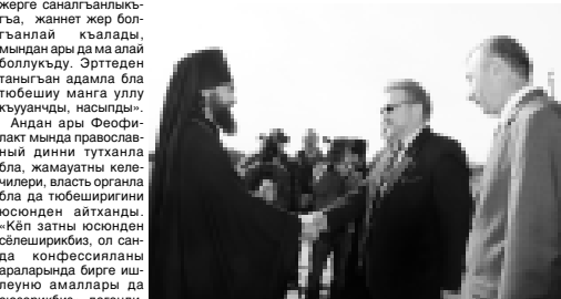
Президент А Канокос Феофилак бля ушакъ этген кезюе.