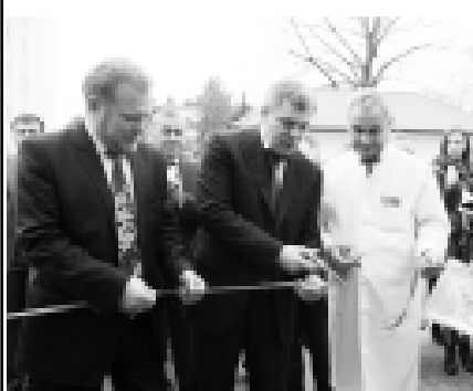
Тюкене Нальчикини биринчи номерли шахар клиника больницы сабийле туууну бѳлѳмо, тынгылы ремонт этилип, жангыртылгъандан сора очылгъанды.

Оп кзууанчы иште къатешда, КъМР-ни Президентни Арсен Канок: «Кѳп тиширюла сабий табаргъа баша регионлагъа барып тургъандыла. Биз болумну тюрлендилликбиз. Жукъу заманда перинатальней ара да ишерикибиз, анда биик технологияны оборудовани салыны