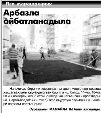
Суратланы МАМАЙЛАНЫ Алий алыганды.

2011 жылны экинчи жазылыу кампания андан ары бардырылады. Сиз «Заман» газетге связъны къайсы почта бёломуна да жазылырга болукъсуз. Алты айга жазылыу багъасы торленгенди, алгыннгылай къалганды - 356 сом 10 капек. Бизни индексибиз - 51532