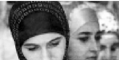
Башлап, ахырында дөргөлө хиджаб кийип келип тегенгенде, педагога хажай этегенлери терге санайды Евкуров. Абдан кыламында окууган кызы кызылганга да юлго болганды деп, республиканы башчысы школда хиджаб киерге эркинлик жокуду деп, оңуч эттеди.

Алгаракылда республикада школда окууган ингушлу кызы бандит подпольега кошулурга аздан кыламынаны юсюндөн хар битер кызылары оюму сагытайханды эди. Абдан кысында окууган кызы ата юйкөндөн кычык кетери. Кеп да бармай аны полицияле Чеченде агач ичинде табдыла. Кызы вайокхим ниетте табынган правосу кыруулмга буюкдурмай айтанды. Шахидка болмай кызылган кызыдан ала бир гранаты да сыйырадыла.