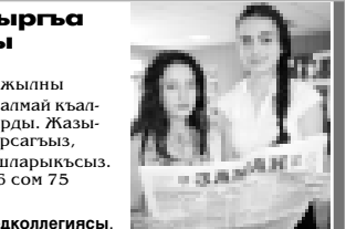
Бизни индексбиз - 51532

циалствиледе деп чортгенди. Станицада 9-чу номерли орта школ да 1911 жылда ишленгенди. Аны къабыргалары алыкъа тутхулудула, болсада инженер коммуникацияны уа алышан дымрай амаз жокъу. Андан сора да, башы, терзелери, зышклерни да бек тозураддыла.