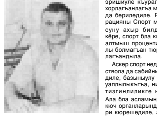
Юно, жашым, кызым не жаны бля да айнысо дей эселе, аны иши башхады. Жашауну спорт бля байламлы этсе, бийик жетишимге жетсе соебиз, дегенле уа спорту Олимпиада тюрлөр-рин сайларга керекиде. Алай профессионал спорт-ол муркулу, кыйын да болганчы, анга хар ким да чыдап кыламга-аны унутурга жарамайды.

Спорт адамы кызыгында бек багваналы кой затны кыруайды: сауукту болуну, кесини кырууну, оңуну тюз бача биче билино эмдэ жетишиме итинуно. Андан сора да, тюрло-пюрлю секциялга жюрюгөнө бир бирлери бля, башка адамга бля да шукү болурга, кыруусузга болушурга, таза ниетликке,