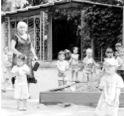
«Улыбка» сабий сады.

Президентине Председатели Майский шахардан жети кило- метр узаклыкка болган таза- лалуучу системаны да кеп керген- ди. Ол да боштон тойлоду. Ан- сыа шахар «Тунгучу» кызыгы- га болуукчу. Алай ача бир белеми, бир кыла тургыны са- беппи аны кырулушу отуз эки жылга созулгангы. Районну администрациясынын башчысына