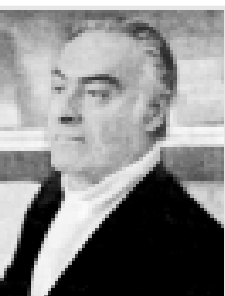
Макитлы Исаканын жашы Сафр Россияны культураны сыйлау кулукчуусу...