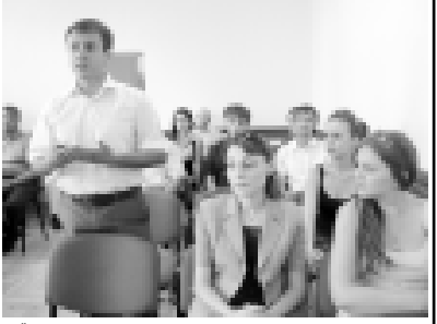
Езданылы Расул сөлөшгөн кезуе.

Пшханн Тауа а алыча жаш төлөгө не идеология элитрге керекперин айтканды. «Шендого экономика болумда кёпле кесирине энчи иш кыруласа игиди», - дегенди. Ызы бла ол кыруал битену халкыга хазыр ишчи жерле кырууламызгынын черттенди. Алайды да, биоген башламчылык бек керекчи. Баямды: битену энчи предпринимательле миллиондыла болмайдыла, алай ала кесирини ююерлерин кечиндиреде. «Адамны жалычаккысызгыны, эркинлик экономика болууу бла, кыоайлыкты – кыоайкысызгыны бла байламлы», - дегенди Тауа. Кыаап сыйюиди тарык Жыйрымачны өмүрдө кыруал, адамланы халал кыаыланын бла жыйган мюлкерин сыйыргы, кыруу кыоула кырааргы ююетем эди. Энди уа: «Мени кыолуна кыраам, башынгы керкиндир, амалла изле», - дейди. Алай жангы дуния келген.