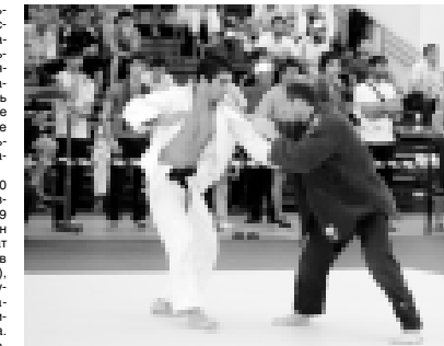
ла, анда кытхала уа Лондонда 2012 жылда болуук Олимпиадага кытшырыкыларын эм алада да бизни спортсменлерибиз кесперин иги жанындан кергюзторюклерине ышанганын билдиргенди.

Бу конлере Кызарты-Малкыарда «Нальчик» спорт комплекседе дзюдодан СКФО-ну чемпионо бардырылганды. Анга Дагыстандан, Чеченден, Ингушетиден, Карачай-Черкесден, Кызарты-Малкыардан, Ставрополь крайдан эм кючюч спортсменге келгендиле. Алапы ичлеринде кыралыны чемпионолары, халкыла аралы турнирлени призёрлары бардыла.