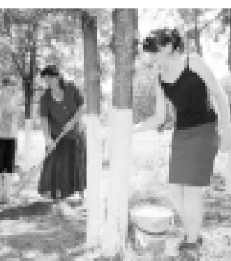
Алыкъын болу ийиси кетмеген школгъа шендо окууна къууанды икере. Жангы окууу жылгъа бу