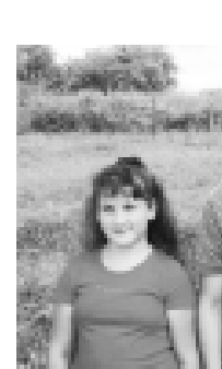
Рамиз бля Зурида.

Тенгиме да кюрюкп, тегергемге кыраганында, ол артыкты сууда кеск чыгып тура эди-деп кыраплаганды жаш.