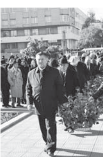
Поэтин эсертмесине гюлле саладыла.

поэзиясыны юсюнден, аны киталлары кеп тилгеге кёчюрюлгенерин, ботюнюде да поэтини оқуучулары миллионла бла саналганын да чертгенди. Къулий улу Къайсын дуниясын алышханды, аны назмулары уа бизни