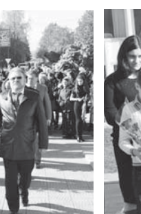
Сабийле байрамны жарыкъ этгенди.

бла къалгандыла - огурулулуктагы, адамлыктагы, игилге чакъыра, деген оюму бла бошаганды сёзон ол эм поэтин назмуун айткенди.