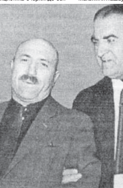
Кзулианы Кайсын бла Гыттыулыны Магомет.