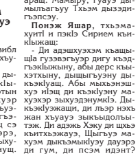
Понэж Ямар, тхэма-хунт и лэжкы Сирием кьынкыахари...