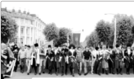
Нашкык квал и урам нэхышкхэм. 2012 гз, накыгэм и 21