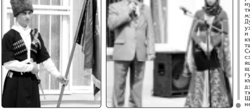
Мы ГЪОМ ягу накыгэм и 21-м хъэлъуагъэу кьышгъуэ зрамыджыуагъэу Тывасэу...