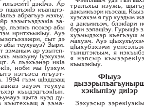
Тыгъэрэ суртгары НыбО Анор ейц.