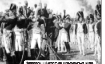
Наполеон шхьэцэпалгэ шыпшэуагъэр илгэ.