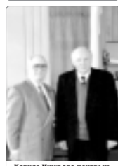
Сиррем и Пыкъуль Эль-Къумейтра и ану-Удыкъу Къуль (1916-1948 гъгъ.)