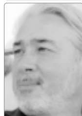
Сиррем и Пыкъуль Эль-Къумейтра и ану-Удыкъу Къуль (1916-1948 гъгъ.)